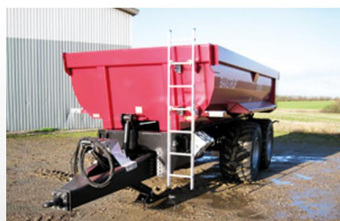
Kassen er af halfrørprofil. Denne vogn er vist med hydraulisk støttestod og justerbar højde på træk. Affjedret træk som ekstraudstyr.