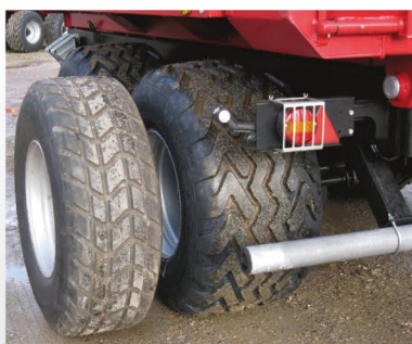
Alternative dækløsninger. Dækket til venstre på billedet er standarddæk.