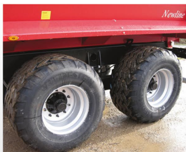
Dækmontering her 620/50 R22,5 (ekstraudstyr). Boltede skærme som standard.