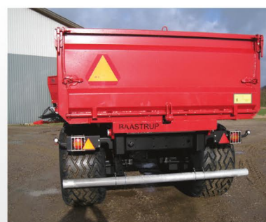
Vognen leveres med prodsøjetræk, påboltet kofanger, lovpligtigt LED-lys og er klargjort til indregistrering.