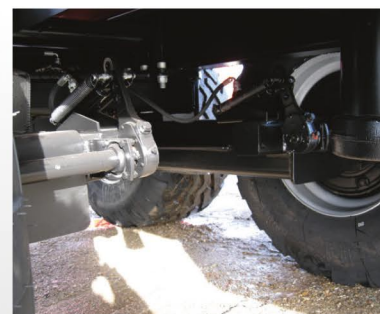
Vognen er monteret med bogie med brems på begge aksler.